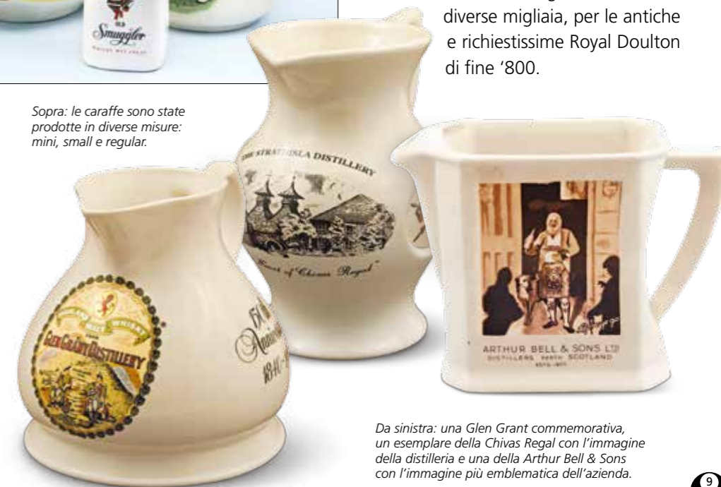
Da sinistra: una Glen Grant commemorativa, un esemplare della Chivas Regal con l'immagine della distilleria e una della Arthur Bell & Sons con l'immagine più emblematica dell'azienda.

Le caraffe da whisky sono state realizzate nei più svariati materiali: dalla terracotta alla ceramica, dal vetro all'argento, dall'alluminio al legno. Molte sono le aziende che le hanno prodotte nel corso degli anni, tra queste ricordiamo Royal Doulton, Shelley, J. Green & Nephew, Wade Regior... Esistono collezionisti di caraffe in tutto il mondo. In Australia è nato il club più importante che riunisce praticamente tutti gli appassionati del globo. Non solo: navigando sul web si possono trovare almeno una decina di siti dedicati alle caraffe da whisky.