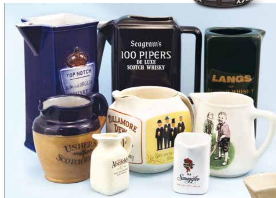
Sopra: le caraffe sono state prodotte in diverse misure: mini, small e regular.

Le caraffe da whisky sono state realizzate nei più svariati materiali: dalla terracotta alla ceramica, dal vetro all'argento, dall'alluminio al legno. Molte sono le aziende che le hanno prodotte nel corso degli anni, tra queste ricordiamo Royal Doulton, Shelley, J. Green & Nephew, Wade Regior... Esistono collezionisti di caraffe in tutto il mondo. In Australia è nato il club più importante che riunisce praticamente tutti gli appassionati del globo. Non solo: navigando sul web si possono trovare almeno una decina di siti dedicati alle caraffe da whisky.