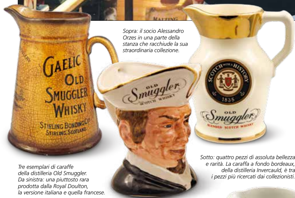
Tre esemplari di caraffe della distilleria Old Smuggler. Da sinistra: una piuttosto rara prodotta dalla Royal Doulton, la versione italiana e quella francese.