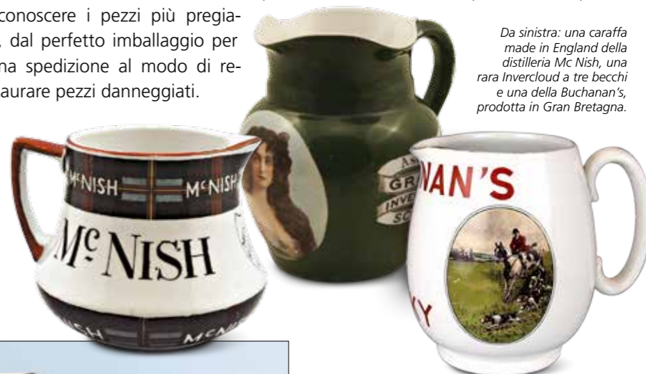
Da sinistra: una caraffa made in England della distilleria Mc Nish, una rara Invercloud a tre becchi e una della Buchanan's, prodotta in Gran Bretagna.

Nessuno conosce esattamente quante caraffe siano state prodotte fino ad oggi. Vi sono diversi collezionisti nel mondo che possono vantare oltre 3000 esemplari; negli Stati Uniti sembra addirittura che esista una collezione che supera i 6000 pezzi!